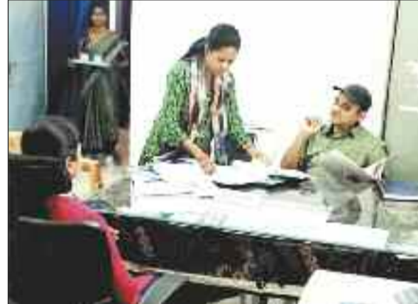
प्रकरण की जांच करते अधिकारी।

स र का र द्वारा बनाए गए थे। लेकिन अब ये इस प्रोग्राम से संबंधित अधिकारी के लाभ की गारंटी होती नजर आने लगी है। इसके पहले भी मनरेगा में कई तरह के भ्रष्टाचार व लापरवाही की शिकायतें आती रही है। कभी भी मनरेगा में मजदूरी करने वाले गरीब को समय पर उसकी मजदूरी नहीं मिल पाती है। मनरेगा से संबंधित अधिकारी कर्मचारी अपने को सर्वशक्तिमान मान बैठे हैं। जिन